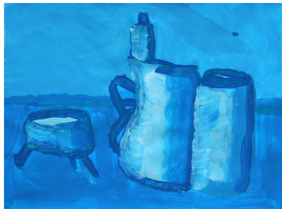
Tomi Kramberger, 9. a

hišo sneg, seveda je mislil, da je sol, in jo takoj poskusil. Imela je drugačen okus in Butalec je mislil, da je našel drugo vrsto soli. To novico je raznesel po vseh Butalah in ko se je vrnil domov, je sneg že skopnel in o soli ni bilo niti sledu več.