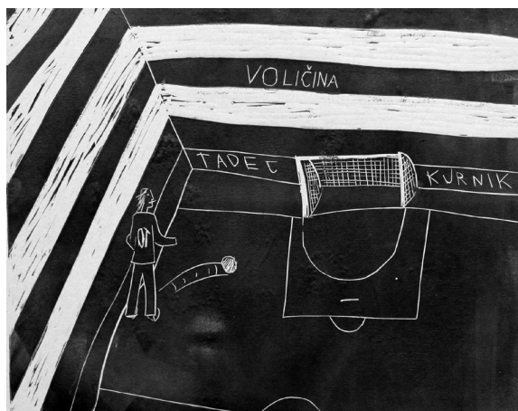
Tadej Kurnik, 7. a