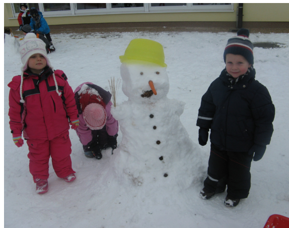
Izdelali smo snežaka.

Na snegu smo bili pravi ustvarjalci. Pred vrtec smo postavili snežaka in stolp, a največje veselje je bilo pre-