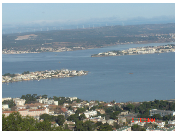
Obmorska pokrajina (v ozadju vetrne elektrarne)