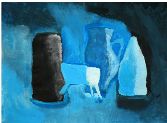
Rok Peklar, 9. a