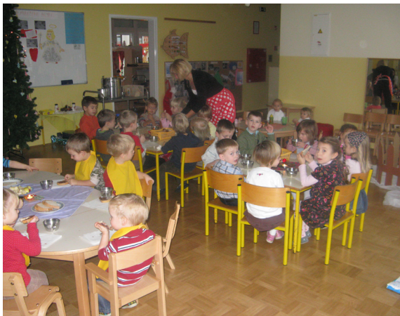
V prazničnem vzdušju nam tudi zajtrk zelo tekne.

... prelepe praznične dni v mesecu decembru. Bilo je veliko smeha, rajanja in lepih doživetij, ki se jih bomo radi spominjali. Okrasili smo vrtec, veliko smo se družili z ostalima skupinama in med nami se tkejo prave prijateljske vezi. Izdelovali smo voščilnice, darilca za naše starše in seveda obiskal nas je Božiček, ki smo se ga vsi zelo razveselili. Ja, veseli december je bil res vesel.