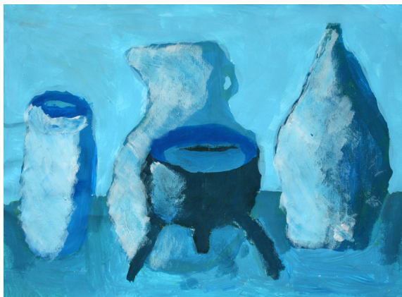
Klemen Ahmetović, 9. b