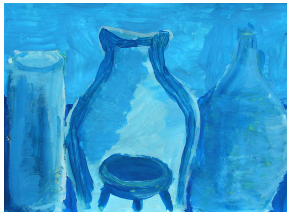
Žiga Živko, 9. b

Delali bi snežaka, se kepali, imeli ga za junaka in se ne pretepali. Ptičjem hišico zgradili, noter hrano nanosili. Dom svoj uredili, ga popestrili in uživali ter praznovali.