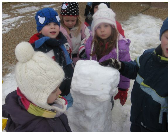
Stolp je kar rasel.

prosto tekanje po snegu in obmetavanje s kepami.