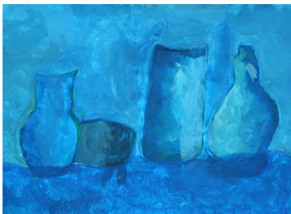
Tina Nemec, 9. b