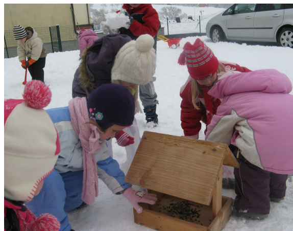
Skrbimo za ptičke, da ne bodo lačni.

Nismo pa pozabili niti na živali, ki jih sneg ni razveselil tako kot nas. V ptičjo krmilnico smo jim natesli zrnja in tako poskrbeli, da ne bodo lačni zaradi bele odeje, ki je pokrila pokrajino.