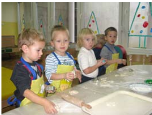
Izdelava okraskov iz slanega testa

Prvi sneg nas je popolnoma prevzel. Oblekli smo topla oblačila in se kljub naletavanju snežink odpravili na sprehod po naselju. Bilo je čarobno. Snežinke smo lovili v rokavičke in jih opazovali. Ste že poskusili? Kako edinstvene so.