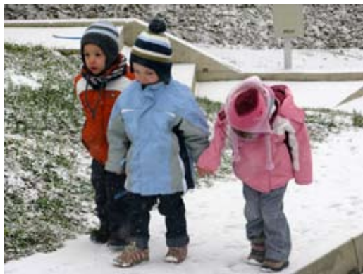
Sprehod ob prvem snegu

Miklavž je bil prvi v vrsti decembrskih mož, ki nas je že obiskal. Ker nas obišče, ko se stemni, smo mu nastavili pisano nogavico. In ko je prišlo drugo jutro, smo komaj čakali, da bomo prvi v vrtcu. Veseli smo bili suhega sadja in medenega peciva.