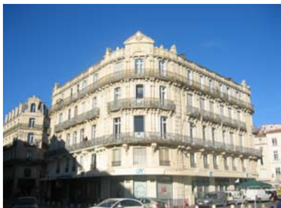
Arhitektura starega mestnega jedra