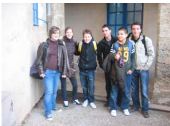
Učenci z gostujočimi prijatelji