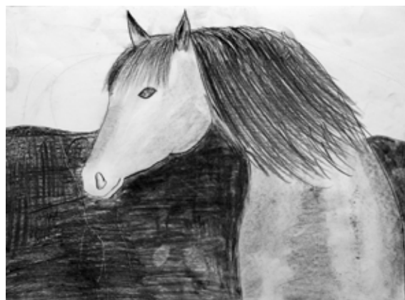
Manja Balaj, 7. b