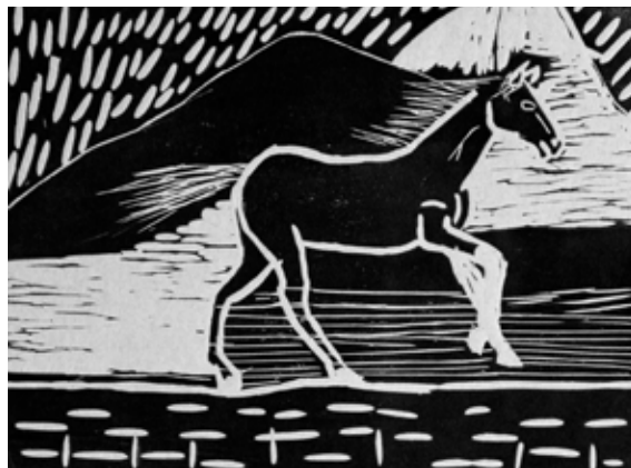
Anja Ornik, 7. b