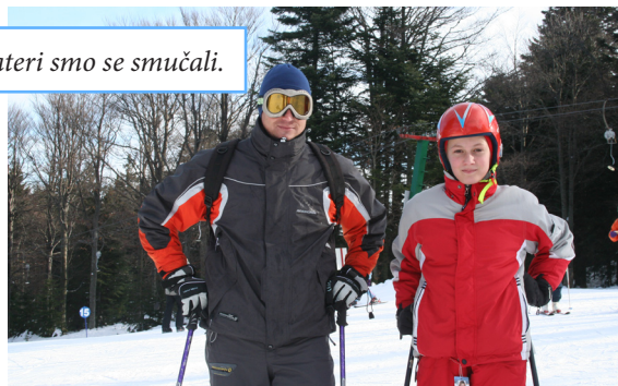
Nekateri smo se smučali.