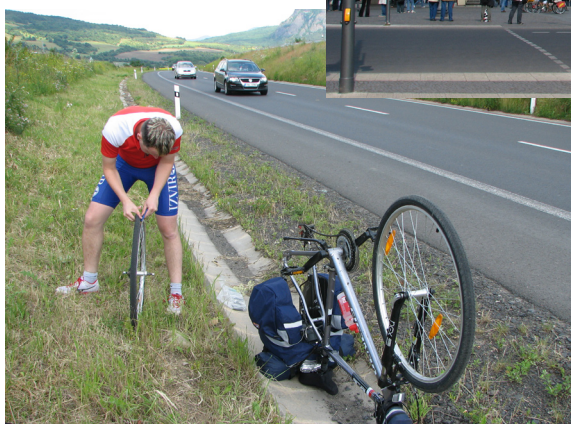
Gumidefekt na avtocesti.