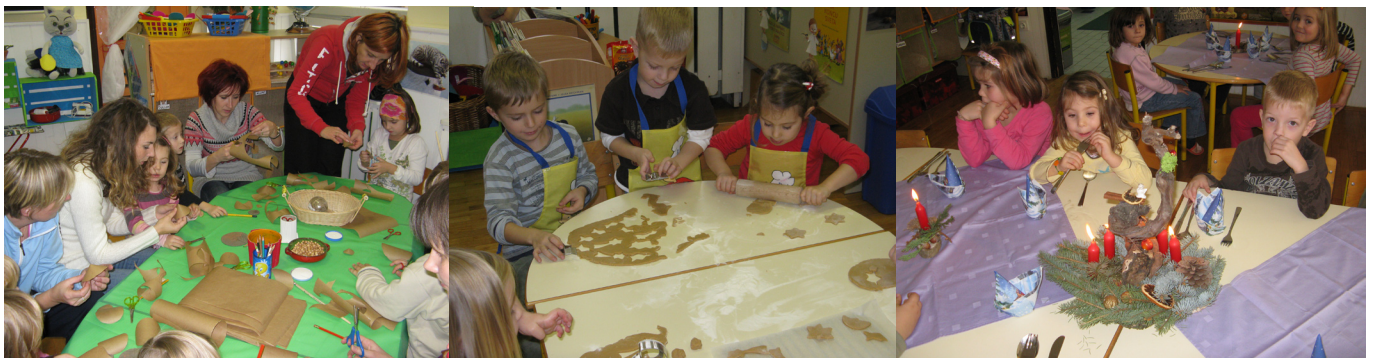
Obisk staršev v vrtcu