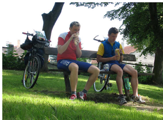
Malica oz. kosilo nekje na Češkem.