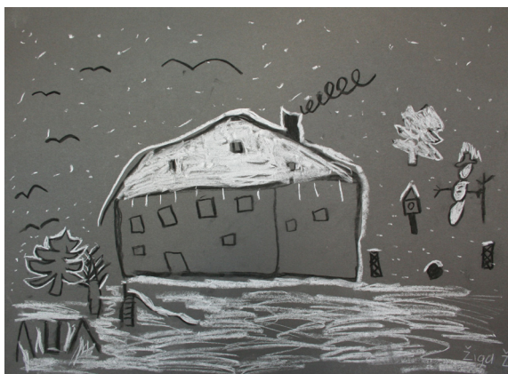
Žiga Žabčič, 3. r.