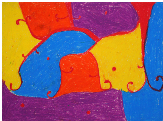
Nastja Krajnc, 6. b