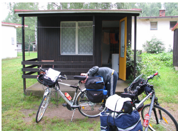
Hutka v kampu.