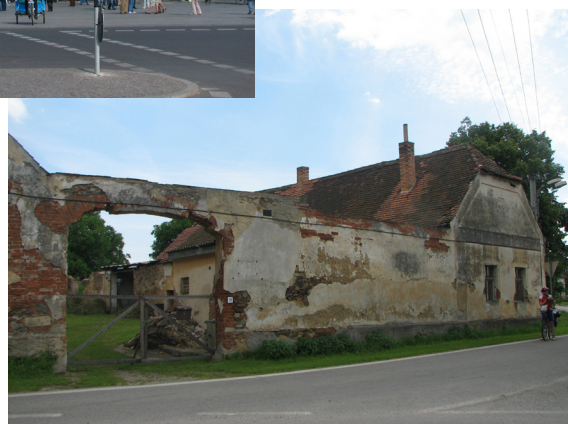
Značilna podoba čeških vasi.