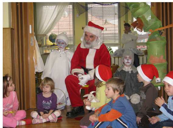
Obisk božička z zajčkom in angelom