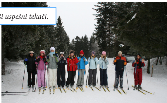
Naši uspešni tekači.