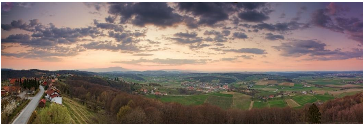
Slika 1: Pogled iz Zavrha na Slovenske gorice

Slovenske gorice – največje gričevje v Sloveniji, ki je za svoje počitnice rad obiskal znan Slovenec, general Rudolf Maister [4], se nahaja na severovzhodu, ob avstrijski meji. Geografsko se delijo na Zahodne Slovenske gorice in Vzhodne Slovenske gorice – Ljutomersko-Ormoške Slovenske gorice. Griči se ponekod dvigujejo do 400 m nadmorske višine. Za to območje je značilno subpanonsko podnebje, v vmesnih ravninah se pojavlja toplotni obrat. Na prisojnih pobočjih gričevja se prebivalci večinoma ukvarjajo z vinogradništvom in s sadjarstvom. Medtem ko se na osojnih pobočjih razprostira listnati gozd. Ravnice so posute z rodovitno prstjo, kjer je razvita živinoreja [5].