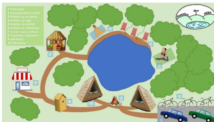
Slika 3: Načrt Ruperške oaze

Ruperška oaza je sproščujoč kotiček, odmaknjen od vsakodnevnega vrževa bližnjih vasi, katerega središče je majhen ribnik. Opisali bi jo lahko z besedami voda, zelenje in narava, saj Ruperška oaza sledi načelom zelenega in trajnostnega turizma.