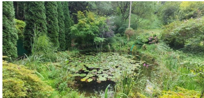
Slika 2: Ribnik - središče Ruperške oaze

Seminarske naloge smo se lotili tako, da smo najprej raziskali, kako je naš kraj povezan z vodo, kje se nahaja najbližji vodni viri in katere vodne površine imamo na razpolago v naši okolici. Nekajkrat smo se sprehodili do različnih vodnih površin in se na koncu odločili, da izberemo manjši ribnik pod naseljem "Župjek", ki leži ob vznožju griča in je obdan z gozdom.