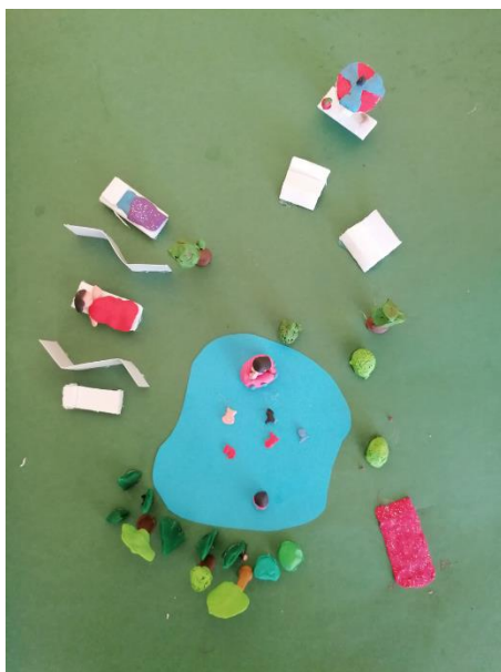
Slika 4: Maketa Ruperške oaze