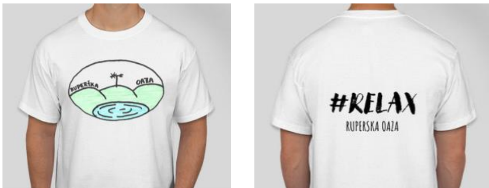
Slika 6: Primer majice z motivom Ruperške oaze

V trgovini s spominki ponujamo unikatne spominke in darila. Majice »RELAX«, spominek »RUPERTEK«, pri katerem lahko izbirate obesek/magnetek in zapestnice.