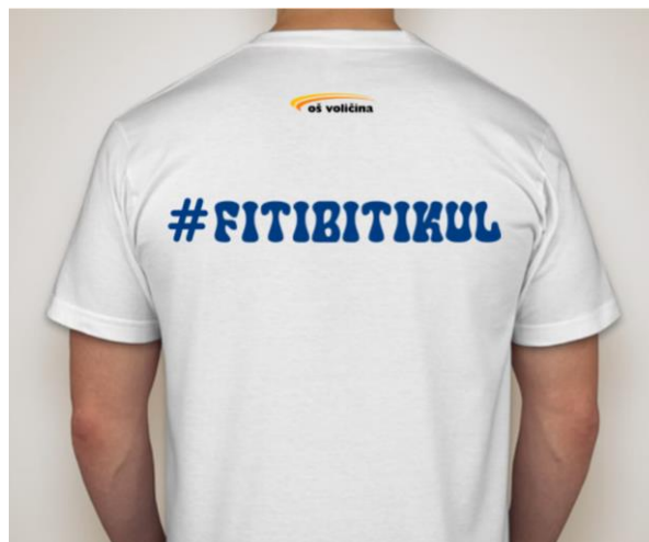
Slika 5: Primer majice z motivom Mini tura