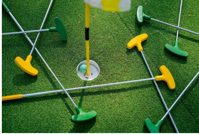
Slika 2: Mini golf

Mini golf je različica golfa, pri kateri se na majhnih stezah z ovirami žogico cilja v luknjo s čim manj udarci. Pri tem želimo, da bi se otroci in odrasli zabavali, sproščali, družili.