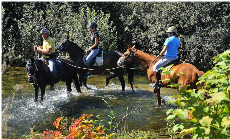
Slika 1: Jahanje

Jahanje konj se nanaša na spretnost ježe, skakanje s konji, zdravljenje hrbtenice. Namen tega je, da bi se otroci in odrasli naučili povezovati s konji. Znano je namreč, da ima jahanje tudi terapevtske učinke. Pri tem se izpostavlja stik z živalmi, saj moraš konja navadno sam pripraviti, očistiti ... Jahalna tura, po kateri bi turisti jezdili, bi potekala mimo gradu Hrastovec, ob enem pa bi turisti lahko spoznali legende in stare običaje, kot je ježa grofov, način življenja na gradu v preteklosti. Primer poti si lahko ogledate na spodnjem zemljevidu.