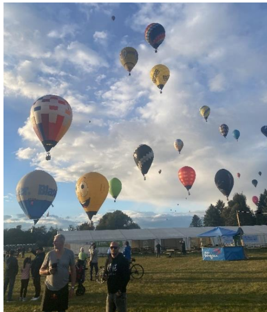
Slika 3: Balonarstvo

Šport, ki je izjemno zanimiv in ga priporočamo vsem, ki imate željo po spoznavanju naše čudovite pokrajine od zgoraj oziroma iz ptičje perspektive, se imenuje balonarstvo. Košara pa je dovolj velika, da se lahko izleta udeležijo večje skupine ljudi (4-24).